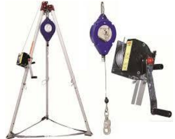
Treppiedi ancoraggio mobile e dispositivo anti caduta

Il nostro personale altamente qualificato e specializzato in tutti i lavori che la nostra Azienda svolge è informato e formato, con corsi periodici ai sensi dell'art.78 decreto lgs 81/2008, sui dispositivi di sicurezza (DPI) e sul loro utilizzo.