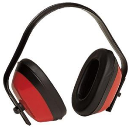
Cuffia anti rumore