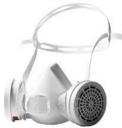
Mascherina Facciale Per rifiuti pericolosi