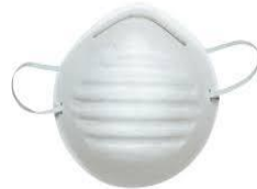
Mascherina usa e getta